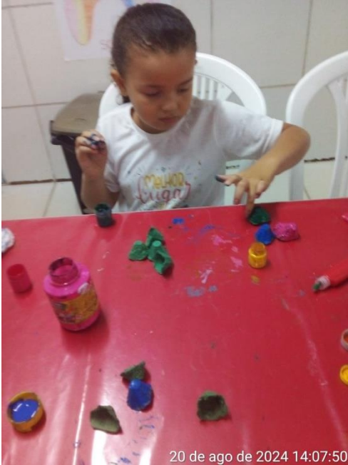
20 de ago de 2024 14:07:50