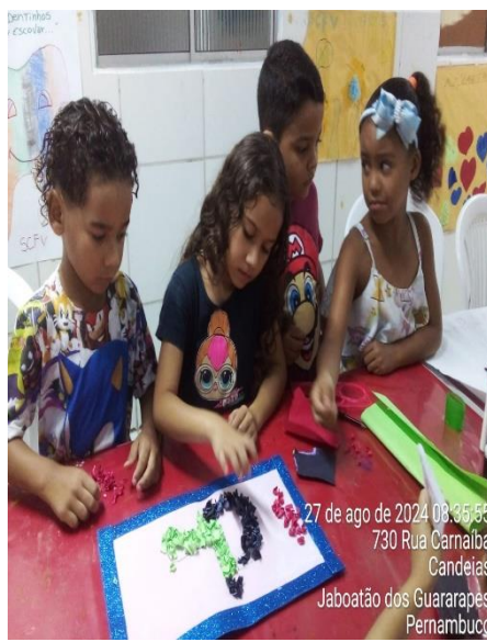
27 de ago de 2024 08:35:55 730 Rua Carnaíba Candeias Jaboatão dos Guararapes Pernambuco