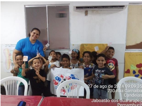
27 de ago de 2024 09:09:35 730 Rua Carnaíba Candeias Jaboatão dos Guararapes Pernambuco