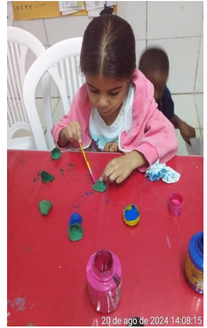
20 de ago de 2024 14:08:15