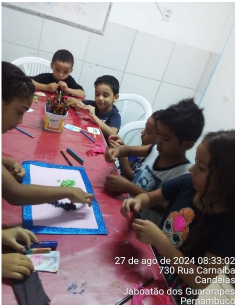
27 de ago de 2024 08:33:02 730 Rua Carnaíba Candeias Jaboatão dos Guararapes Pernambuco