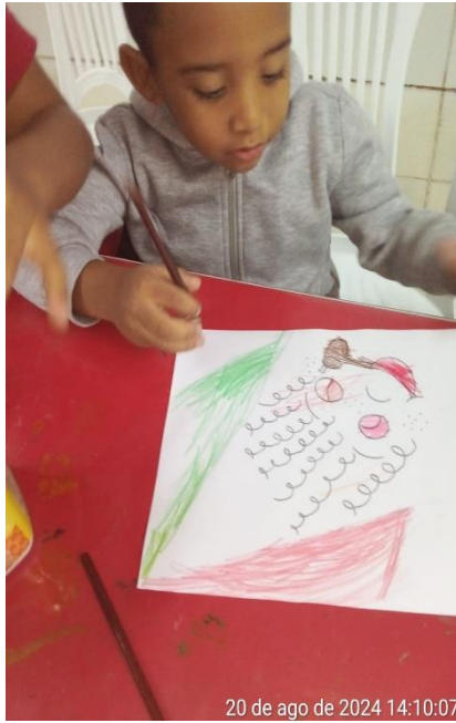
20 de ago de 2024 14:10:07